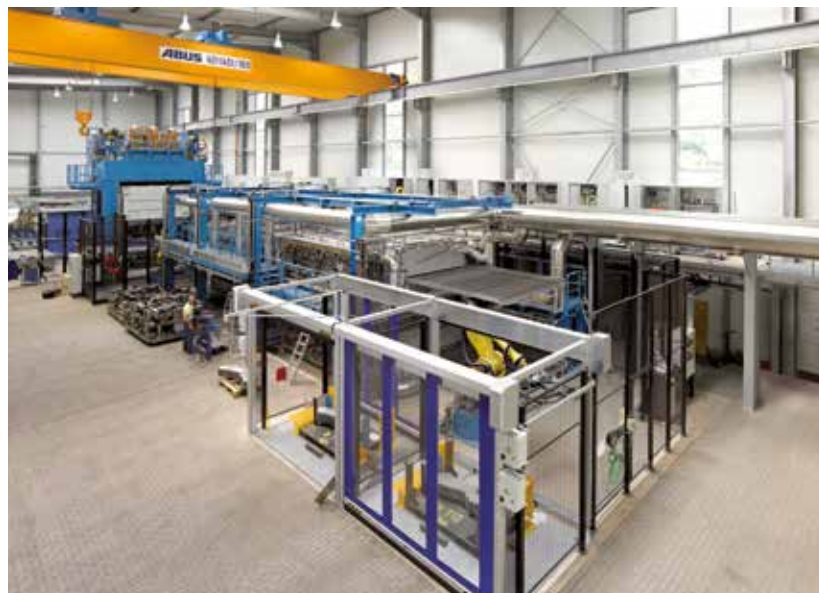
BRAUN CarTec. Deutschland.