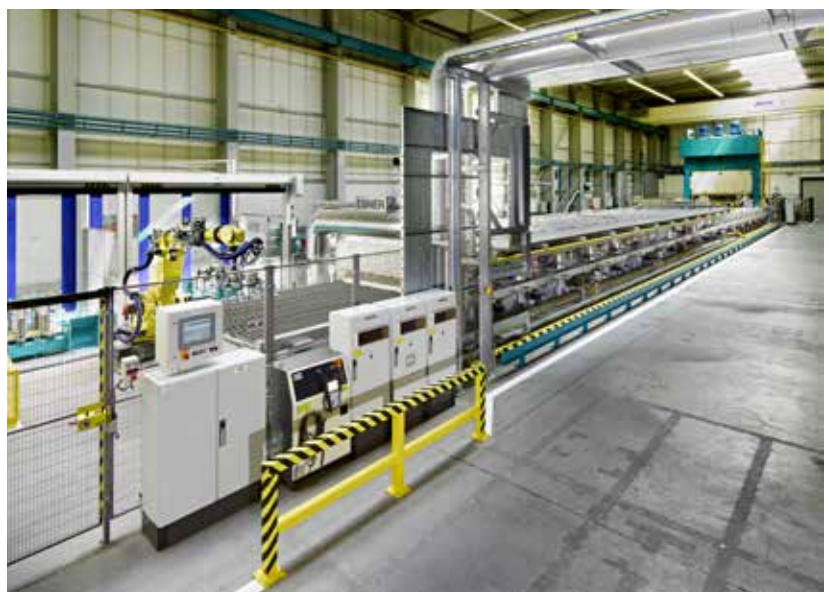
GEDIA Poland. Polen.

Durch die von EBNER angebotene Hybridheizung können Investitionen sowie Laufkosten niedrig gehalten werden.