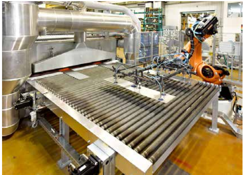
BRAUN CarTec. Deutschland.

Mit der Rollendrehüberwachung können sowohl für präventive Wartungsmaßnahmen als auch für den Störfall Maßnahmen eingeleitet und umgesetzt werden.